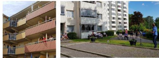
Lite av stämningen under de olika spelningarna...