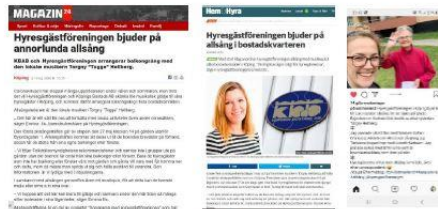
Några ex. på insändare som gjordes av bl.a. Magasin24, Hem&Hyra, P4 Västmanland...

Statistiken från Hyresgästföreningen Västmanlands Facebooksida där vi publicerade inlägg om allsång i Köping.