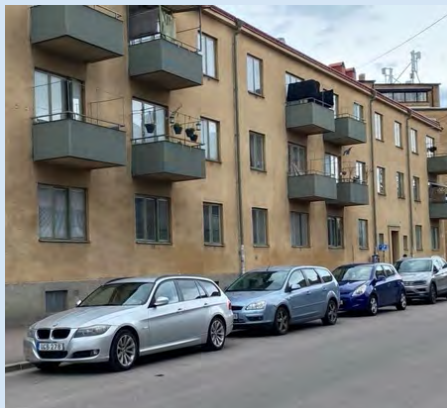
Hus som ska säljas. Från vänster: Bergslagsgatan 11, Kilsgatan 4-6.